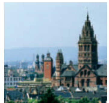
Mainz – eine prosperierende Stadt im Wirtschaftsraum Rhein-Main