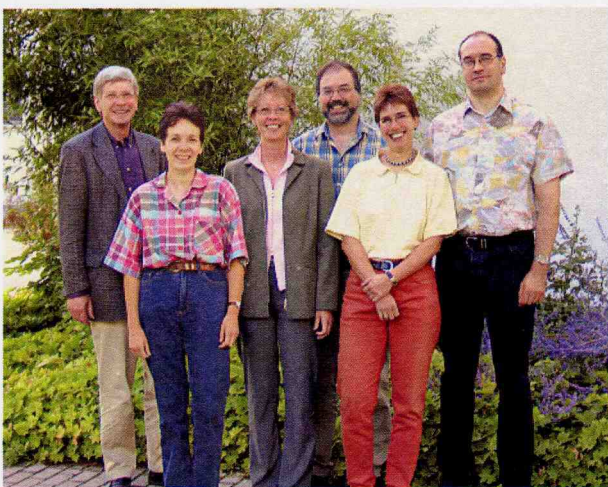
Das Umweltteam des Umweltamtes

Darüberhinaus ist das Umweltamt auch Dienstleister im Bereich vorsorgender Umweltschutz. Durch fachliche Beratung und Information von privaten Haushalten, Firmen und Organisationen sowie Dienststellen (auch verwaltungsintern) in Umweltfragen sollen Umweltschäden vermieden bzw. Ressourcen geschont werden. Hierzu dienen auch Einrichtungen wie das UmweltInformationsZentrum und das Umweltbildungszentrum mit Freilandklassenzimmer.