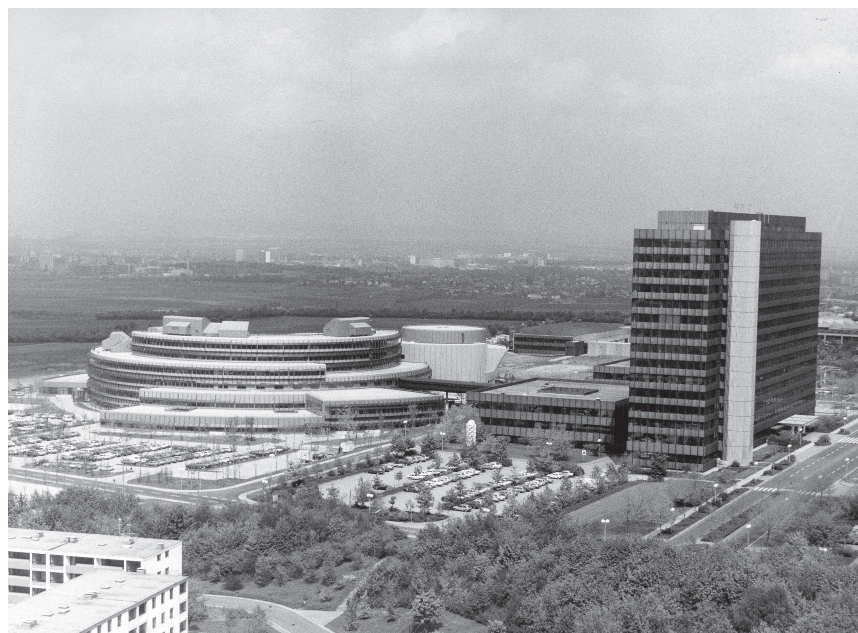
Sendezentrum des ZDF auf dem Lerchenberg, 15. Mai 1984.