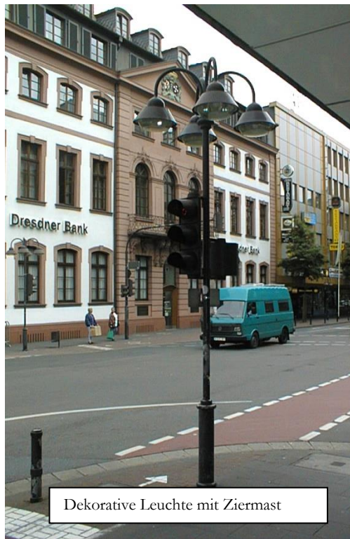
Dekorative Leuchte mit Ziermast