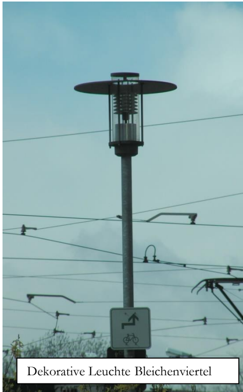
Dekorative Leuchte Bleichenviertel