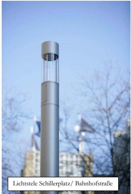
Lichtstele Schillerplatz/ Bahnhofstraße