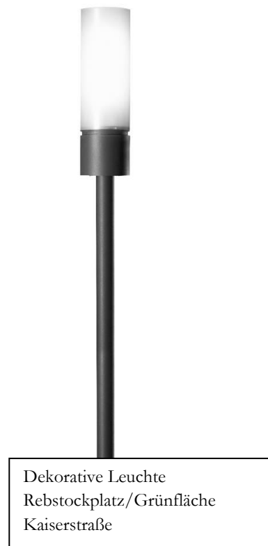
Dekorative Leuchte Rebstockplatz/Grünfläche Kaiserstraße