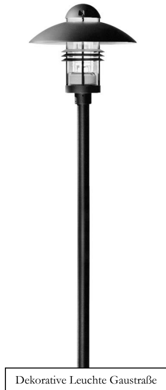
Dekorative Leuchte Gaustraße