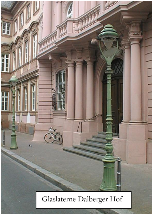
Glaslaterne Dalberger Hof