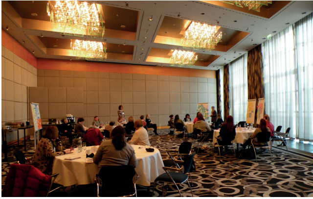
Werkstattgespräch am 4. März 2022 im Hyatt Regency Mainz