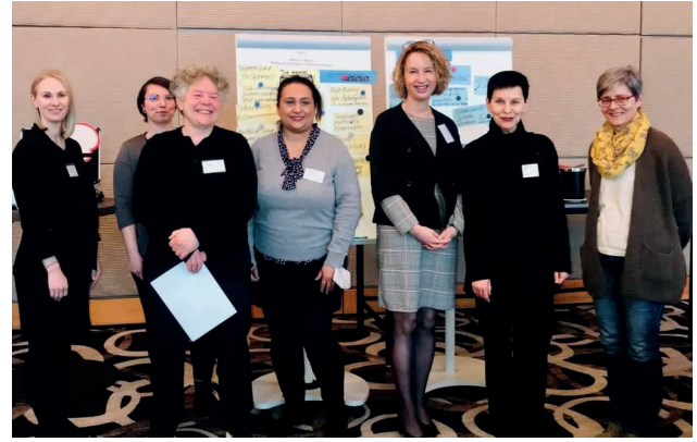
Veranstalterinnen und Gastgeberinnen des Werkstattgesprächs