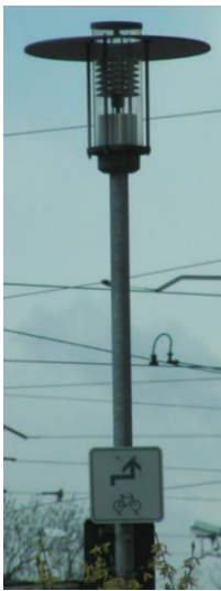
Dekorative Leuchte Bleichenviertel