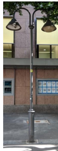
Dekorative Leuchte mit Ziermast – zweiköpfig