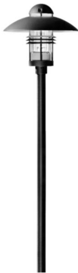
Dekorative Leuchte Gaustraße