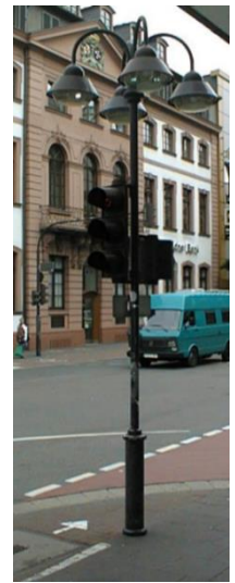
Dekorative Leuchte mit Ziermast