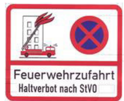
Abbildung 1: Kennzeichnung der Feuerwehrezufahrt

Die im Rahmen der Veranstaltungsgenehmigung festgelegten Flächen für die Feuerwehr (Zugänge, Feuerwehrezufahrten, Aufstellflächen, Bewegungsflächen) sowie Flucht- und Rettungswege sind im gesamten Veranstaltungsbereich während der gesamten Zeit der Nutzung von jeglichen Aufbauten freizuhalten. Die bestehenden Zugänge und mit Hinweisschildern gekennzeichneten Feuerwehrezufahrten zu Gebäuden im Veranstaltungsbereich dürfen nicht eingeschränkt werden.