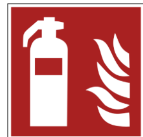
Abbildung 2: Hinweisschild nach ASR 1.3

Beim Betrieb von Flüssiggasanlagen ist ein geeigneter Feuerlöscher der Brandklasse „C“ gemäß ASR A2.2 bereitzustellen. Mitarbeiter sind in der Handhabung von Feuerlöschern zu unterweisen. Ggf. sind Hinweisschilder nach ASR 1.3 anzubringen.