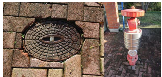
Abbildung 3: links. Unterflurhydrant, rechts Überflurhydrant

Löschwasserentnahmeeinrichtungen (Über- und Unterflurhydranten) für die Feuerwehr sind einschließlich ihrer Kennzeichnungen von Aufbauten oder Lagerungen im Umkreis von 1 Meter freizuhalten und müssen jederzeit zugänglich sein. Standrohre zur Wasserentnahme aus Unterflurhydranten sind im Verlauf von Laufwegen durch geeignete Absperurmaßnahmen abzusichern. Die notwendige Fluchtwegbreite darf nicht eingeschränkt werden.