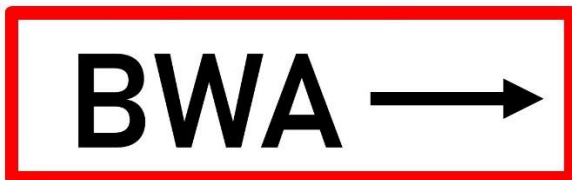
Abbildung 2: Beispiel Hinweisschild Laufweg Brandwarnzentrale nach rechts