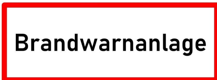
Abbildung 1: Beispiel Hinweisschild Brandwarnanlage